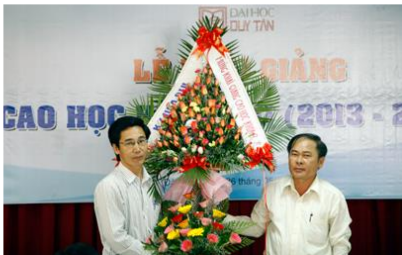
Đại diện học viên Cao học khóa VII tặng hoa cho học viên khóa VIII

môn học, học vượt nhằm rút ngắn thời gian của Khóa học. Thời gian đào tạo Cao học là 2 năm nhưng học viên được có thể kết thúc khóa học trong 1,5 năm nếu đáp ứng đầy đủ yêu cầu môn học của giảng viên.