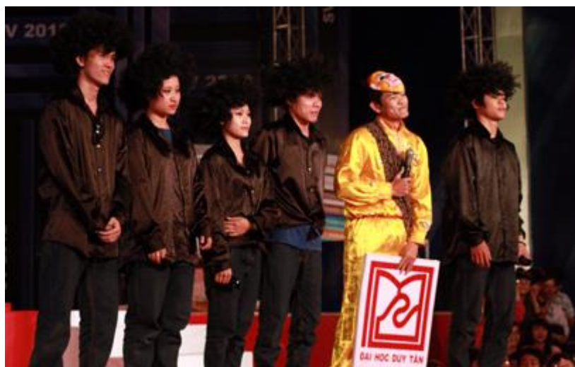
Tiết mục Lời chào SV của sinh viên Duy Tân

Trước không khí rộn ràng tiếng trống, tiếng reo hò cổ vũ cho sự trở lại của các nhà thông thái vui tính, các đội đã rất phấn khích trải qua 3 phần thi: Lời chào SV, SV Thông thái, Tài năng SV. Các bạn sinh viên Duy Tân với màu áo vàng có in logo trường ở ngực trái đã rất tự tin thể hiện sự thông minh, dí dỏm suốt cuộc thi.