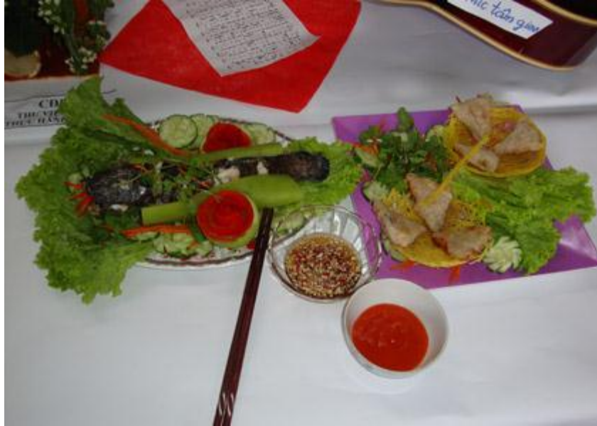
Tác phẩm đạt giải khuyến khích của công đoàn thư viện

Kết thúc cuộc thi, giải nhất phần thi cắm hoa với tác phẩm “ Vườn đến những tâm cao ” thuộc về công đoàn khoa Ngoại ngữ, giải nhất phần thi nấu ăn thuộc về công đoàn Khoa Du lịch và Khoa ĐTQT với hai món “Súp cua” và “Mực nướng”.